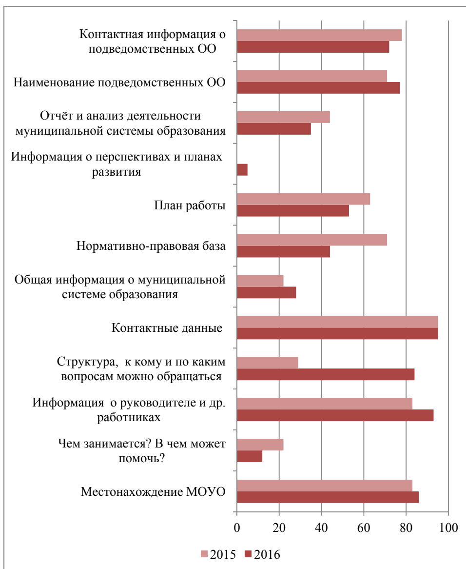
Изменения значений «формальных» показателей за 2015-2016 гг., % от общего количества сайтов

По результатам анализа «информативные» сайты у МОУО Барабинского, Исктимского, Каргатского, Куйбышевского и Тогучинского районов. Сайты Исктимского и Тогучинского районов были в числе лидеров и в прошлом году.